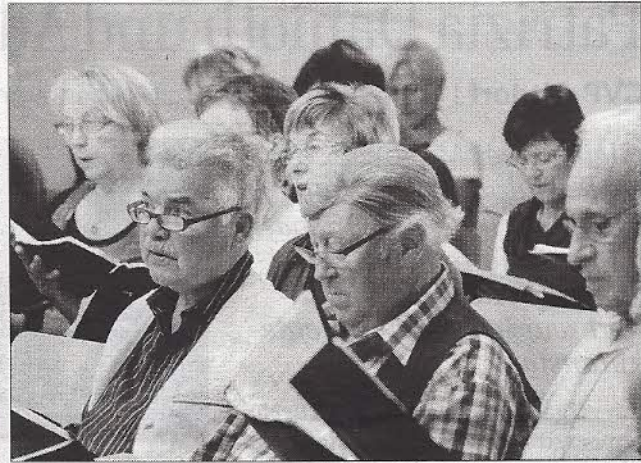
Probeimpressionen: Die preisgekrönten Werke kommen bei den Sängerinnen und Sängern sehr gut an.